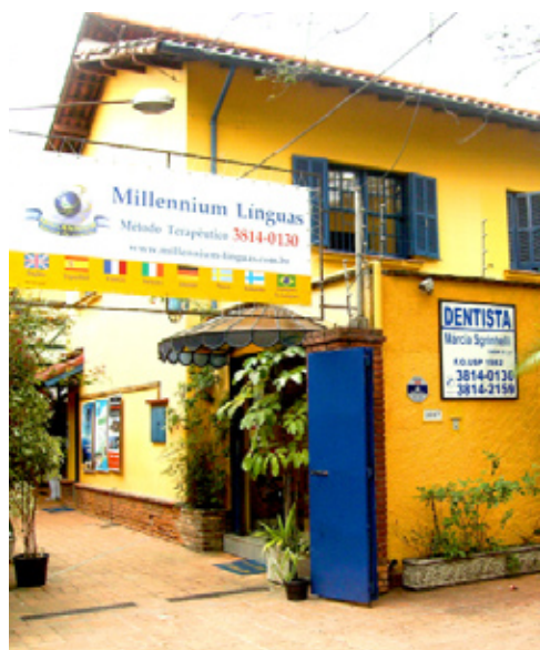
Acima, a primeira unidade das Escolas de Línguas Millennium, na av. Rebouças 3887.