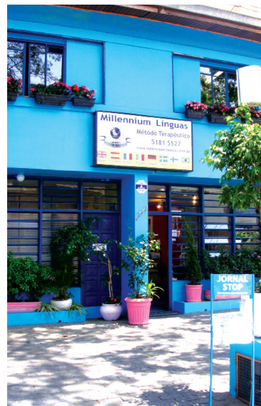
Foto da Escola de Línguas Millennium, unidade Granja Julieta, na rua Américo Brasiliense, 1777