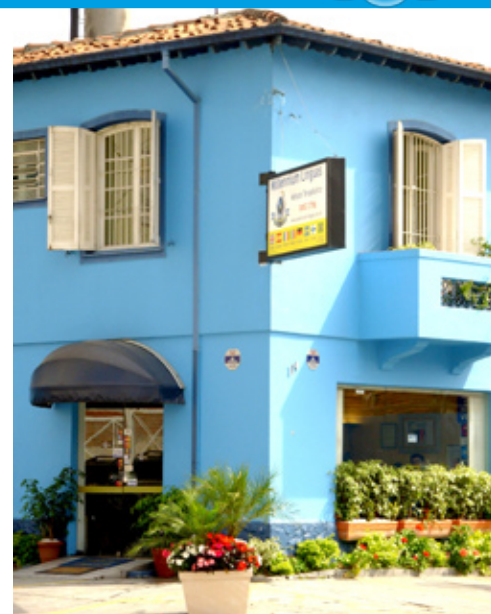
Unidade Moema, a mais nova e pujante unidade da Millennium Línguas, na Al. Maracatins, 114

“Os assuntos de psicologia, de filosofia, de espiritualidade, ajudam muito os alunos a entender melhor os problemas e a lidar com a própria vida, as situações na família, com os amigos, no trabalho etc. Os alunos aprendem o idioma através de assuntos que têm um nível superior e que ajudam o desenvolvimento da pessoa.”