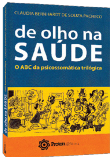
Este livro será uma das bases do primeiro módulo do curso Técnico em Saúde Psico-Social