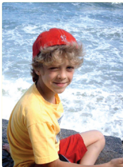
Só a pessoa que se vê pequena pode ser sábia, voltando a aprender como as crianças

Por esse motivo, o criador do método psicolinguístico de ensino acentua que o indivíduo soberbo é semelhante ao riozinho que corre solitário, sem afluentes, no topo de uma montanha; ao passo que o humilde se assemelha ao Amazonas que, indo abaixo dos outros rios, recebe a afluência de todos, tornando-se o maior rio do mundo.