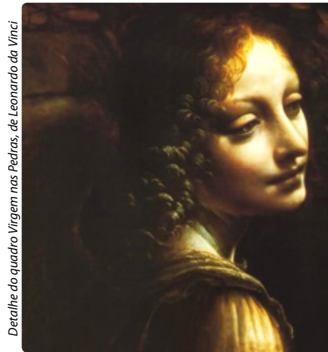
Detalhe do quadro Virgem nas Pedras, de Leonardo da Vinci

A partir do momento em que o homem começa a aceitar essa volta para si, então inicia-se a cura. Quanto mais faz esse mo-