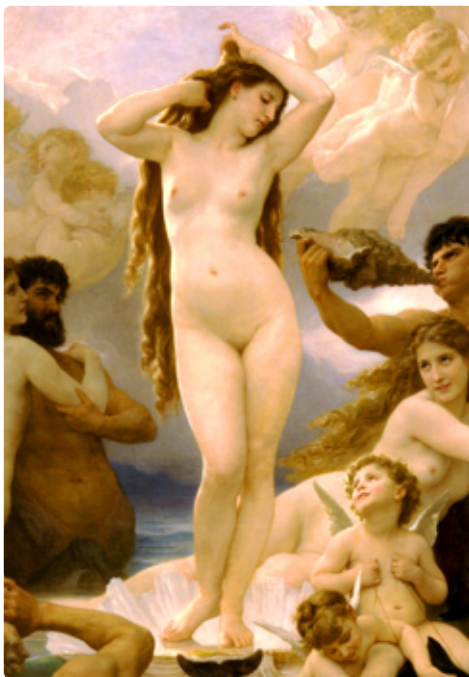
The Birth of Venus, William Adolphe Bouguereau, 1879

– Inclusive que somos inteiramente jungidos a Ele.