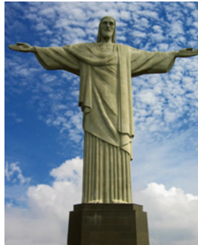
Cristo Redentor - RJ

Extrato do livro História Secreta do Brasil - O Millennium e o Homem Universal - 3ª. ed. 2007 www.editoraproton.com.br (11) 3032 3616