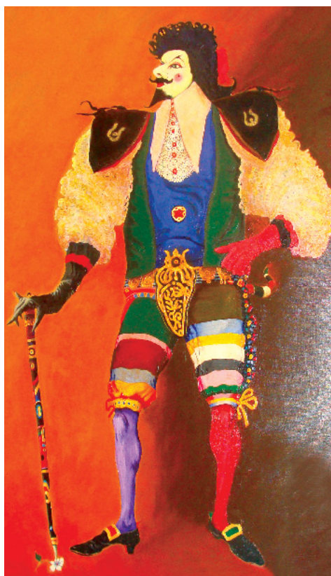
"A Arrogância (Catinari)

De modo geral, o que o povo denominou de doença são apenas os sintomas físicos, que são o resultado das emoções descontroladas – portanto, de descontroles físicos passageiros.