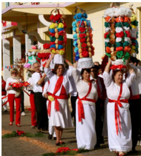
Desfile dos Tabuleiros

Os eventos - que visam ajudar a cidade e região do Circuito das Águas a recuperar seu antigo esplendor, através das artes e cultura - são organizados pela As-