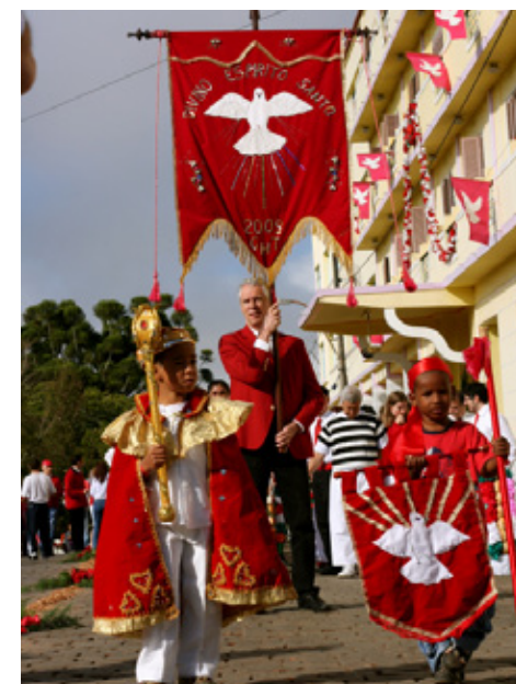
Procissão da Bandeira do Divino