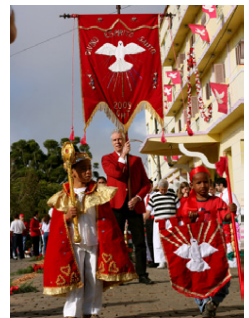
Procissão da Bandeira do Divino