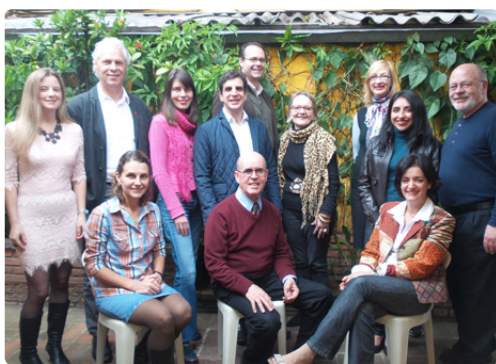
A equipe de professores do Trilogy Institute é formada por europeus, americanos e brasileiros com larga experiência no exterior, treinados no método keppeano de ensino.

As emoções, os pensamentos, todos estes aspectos essenciais da vida do