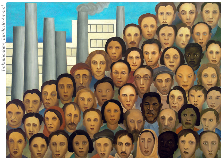
Trabalhadores, Tarsila do Amaral

A megalomania e arrogância se alimentam dessa ideia de se achar perfeito, e ao mesmo tempo em pensar que só o próximo está coalhado de erros.